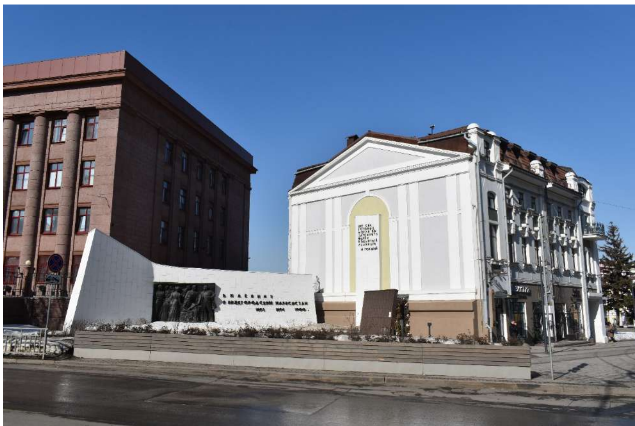
Общий вид на Объект от стыка улиц Малая Покровская и. Большая Покровская