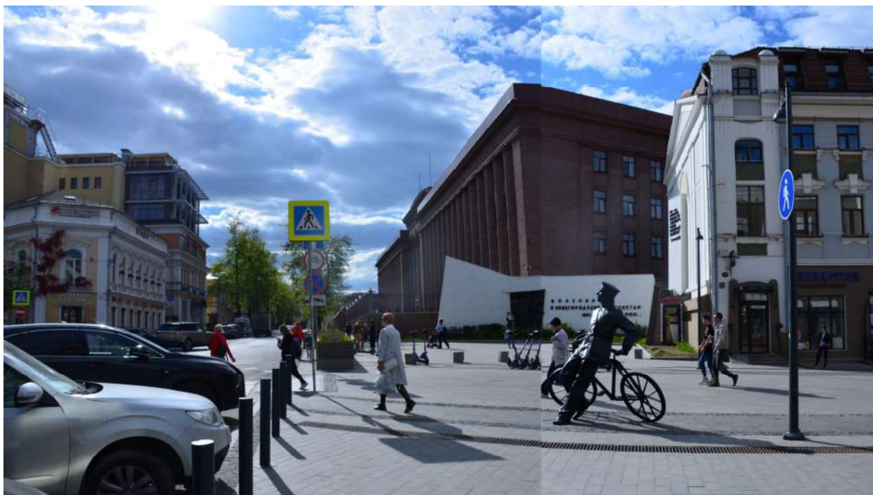
Общий вид в сторгону Объекта от стыка улиц Звездинка, Малая Покровская и. Большая Покровская

Объект культурного наследия регионального значения «Место, где находилась гостиница Никанорова, в которой в 1893 г. состоялась первая встреча Владимира Ильича Ленина с нижегородскими марксистами. На этом месте установлена стела с бронзовым горельефом» (Нижегородская область,